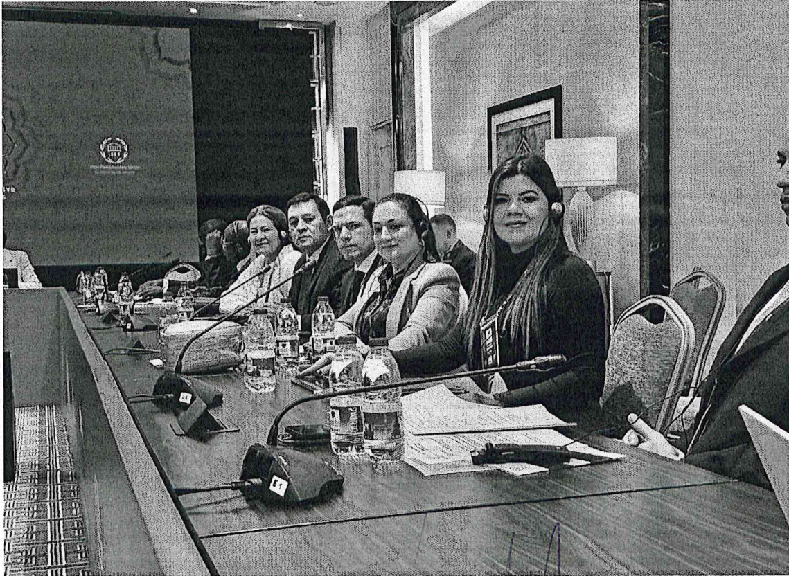
Momento de intervención en los debates de las distintas Comisiones.

Misión: "Legislar y controlar acorde a la representación departamental y capital, para la consolidación del estado social de derecho"