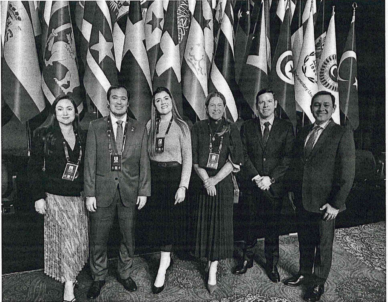
Parte de Comitiva Oficial que participó de la 152 a Asamblea de la Unión Interparlamentaria.

Misión: "Legislar y controlar acorde a la representación departamental y capital, para la consolidación del estado social de derecho"